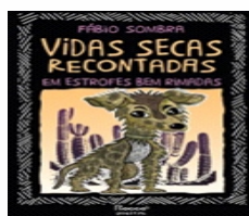
Vidas Secas Recontadas Editora: Rocco Autor: Fábio Sombra